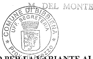
TABELLA DI VALUTAZIONE DEL COMPENSO PER LA VARIANTE AL P.R.G.

allegato _____) alla deliberazione N. 98 del 20/04/06