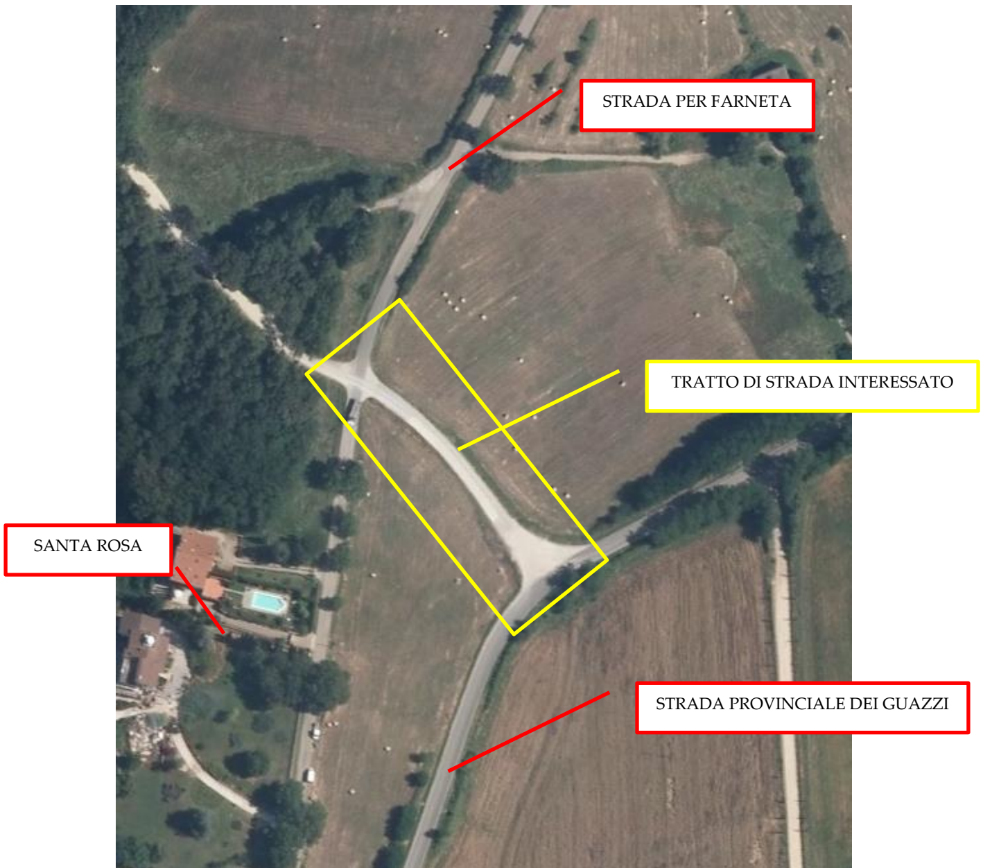
Figura 2 Individuazione del tratto stradale