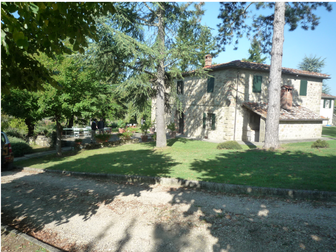
fotografia 2 – prospetto sud-ovest (in primo piano tratto di strada che verrà eliminato in virtù di quanto autorizzato con CILA n. 23516 del 24-12-2019 )