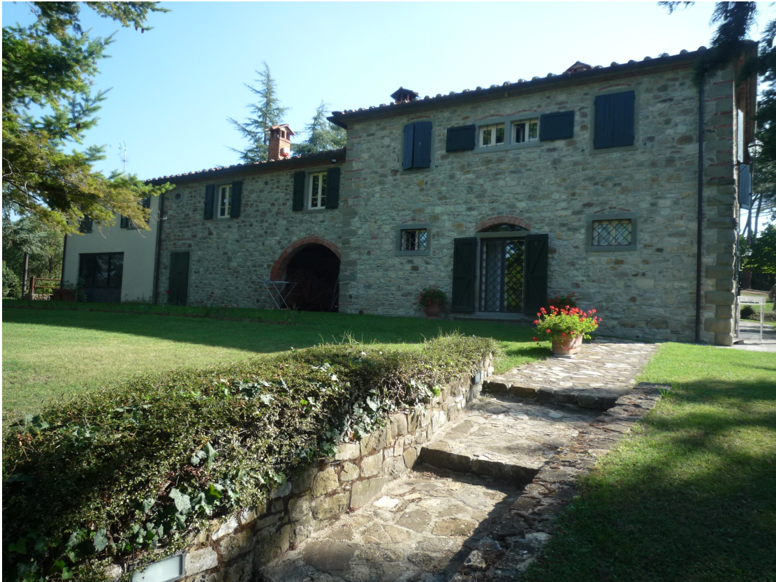
fotografia 1 – prospetto ovest