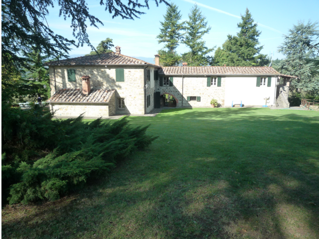
fotografia 3 – fronte est