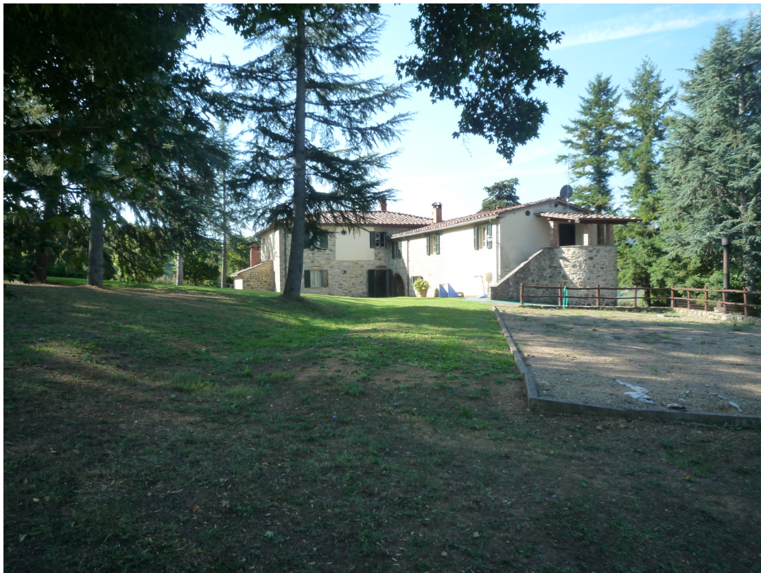
fotografia 4 – fronte nord-est